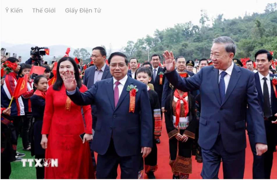
Tổng Bí thư Đảng Tô Lâm và Thủ tướng Phạm Minh Chính chào người dân địa phương trong lễ khởi công tại Tỉnh Lãn Sún vào sáng thứ Năm.

Bộ giáo dục và Bộ Tài chính đang xem xét các đề xuất phân bổ kinh phí, với mục tiêu hoàn thành các dự án trước ngày 30 tháng 8 năm 2027, kịp thời cho năm học 2027-28.