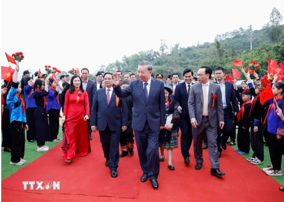
Tổng Bí thư Đảng Tô Lâm và Thủ tướng Phạm Minh Chính tham dự lễ khởi công tại tỉnh Lãn Sún vào sáng thứ Năm cho 121 trường tiểu học và trung học cơ sở nội trú đa cấp ở các xã biên giới trên toàn quốc.

Động thái này diễn ra sau kết luận của Bộ Chính trị Đảng Cộng sản Việt Nam về việc thành lập các trường nội trú đa cấp ở các xã biên giới và nhằm mở rộng khả năng tiếp cận giáo dục, thu hẹp sự chênh lệch giữa các vùng và tăng cường quốc phòng và an ninh.