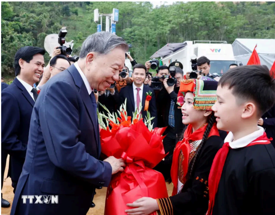
Ethnische Kinder in der Provinz Lạng Sơn überreichen dem Generalsekretär der Partei, Tô Lâm, Blumen.

Gleichzeitig fanden Spatenstiche für mehrstufige Internate in Grenzgemeinden statt, ein Schritt, der darauf abzielte, Schülern im Grenzgebiet einen gleichberechtigten Zugang zu Bildung zu gewährleisten, regionale Unterschiede zu verringern und die Landesverteidigung und -sicherheit zu stärken.