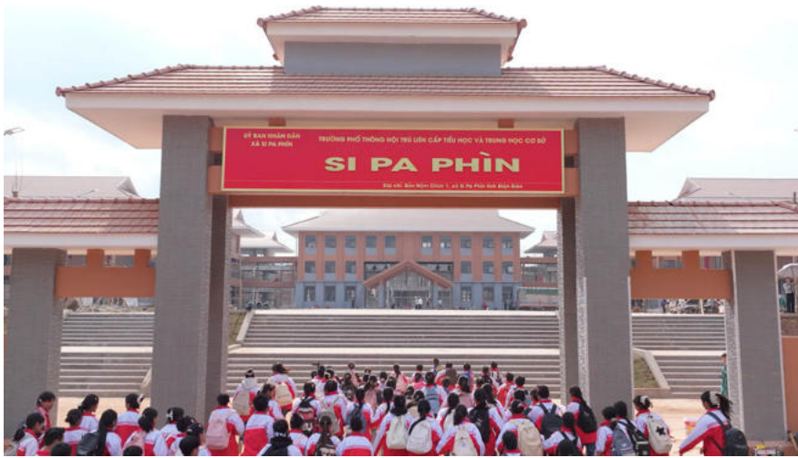
Die Schüler kommen aufgeregt, um die neue Schule kennenzulernen.