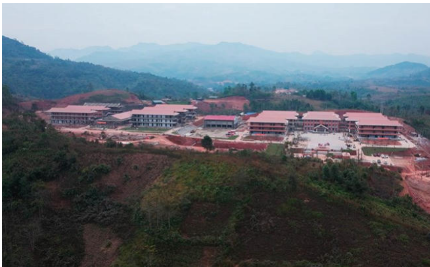
Die Si Pa Phin Inter-level Boarding Primary and Secondary School bereitet sich auf die Einweihung vor.

Dien Bien - Das übergeordnete Internat in der Grenzgemeinde Si Pa Phin ist die erste Schule, die gemäß der Politik des Politbüros eingerichtet wurde, und bereitet sich auf seine Fertigstellung vor.