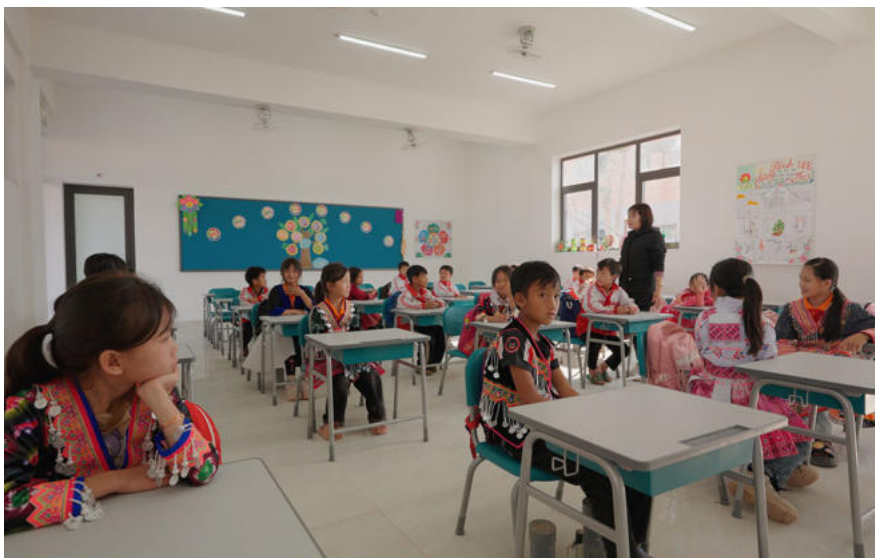
Lehrer und Schüler besuchen das neue „Zuhause“ und lernen es kennen.