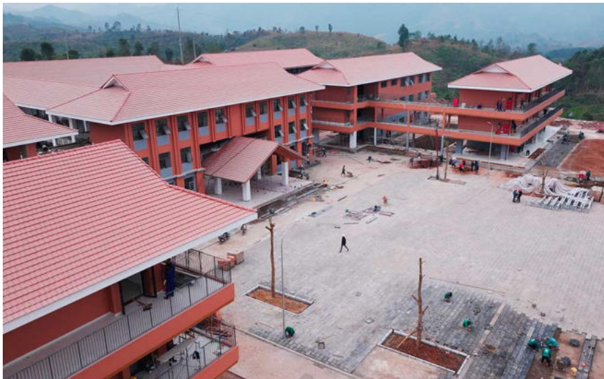
Die Arbeiter stellen die letzten Gegenstände fertig, um sich auf die Einweihungszeremonie vorzubereiten.