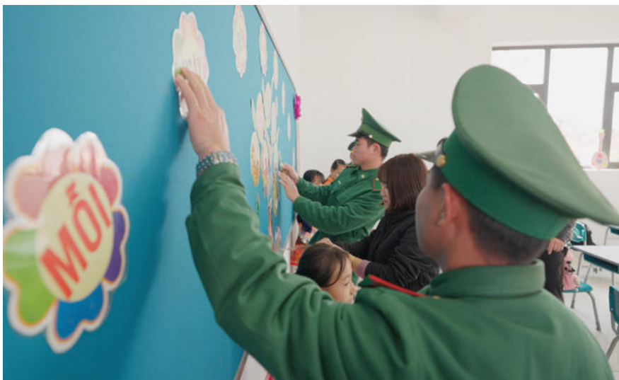
Grenzschutzbeamte und Soldaten arbeiten auch gemeinsam an der Vorbereitung und Dekoration von Schulen und Klassenzimmern.

Zuvor, am 27. Juli 2025, wurde das Projekt Si Pa Phin Inter-level Boarding Primary and Secondary School offiziell gestartet und ist das erste Projekt unter 248 Schulen in Landgrenzgemeinden, das gemäß der Politik des Politbüros umgesetzt wurde.