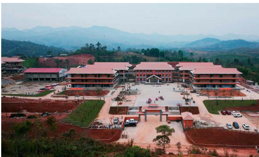
Das Projekt „Si Pa Phin Commune Inter-level Primary and Secondary School“ umfasst eine Gesamtinvestition von 220 Milliarden VND (ohne Entschädigungen und Kosten für die Standorträumung) aus dem Unterstützungskapital und dem sozialisierten Kapital der Stadt Hanoi.

Das Projekt „Si Pa Phin Commune Primary and Secondary Inter-level Boarding School“ ist ein Projekt der Gruppe B mit einer Gesamtinvestition von 220 Milliarden VND (ohne Entschädigungen und Kosten für die Standorträumung) aus dem Unterstützungskapital und dem sozialisierten Kapital der Stadt Hanoi.