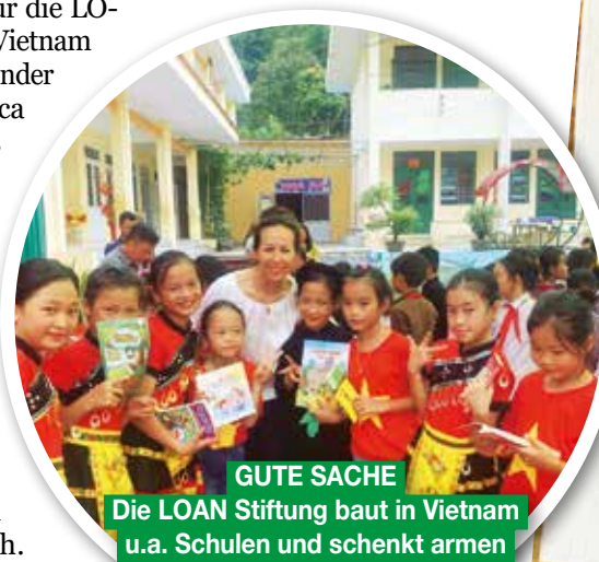
GUTE SACHE Die LOAN Stiftung baut in Vietnam u.a. Schulen und schenkt armen Kindern eine Zukunft. Infos: https://loan-stiftung.de