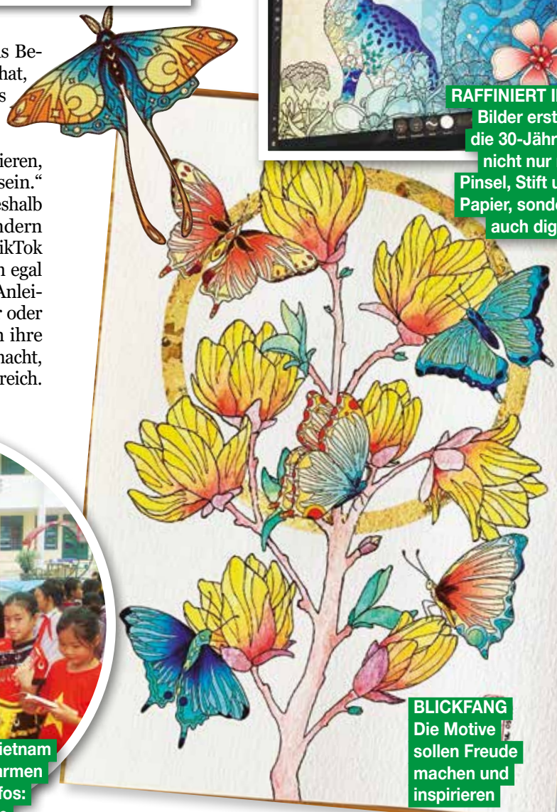
BLICKFANG Die Motive sollen Freude machen und inspirieren