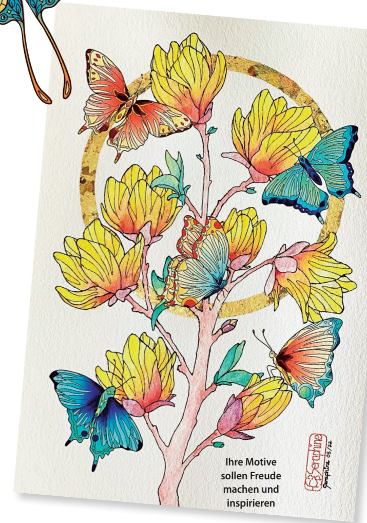
Ihre Motive sollen Freude machen und inspirieren