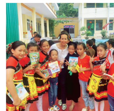
Die LOAN-Stiftung baut in Vietnam u.a. Schulen und schenkt armen Kindern eine Zukunft. Infos: https://loan-stiftung.de