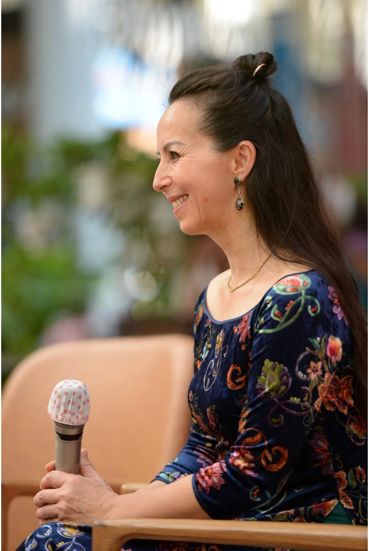
Tác giả Isabelle Müller