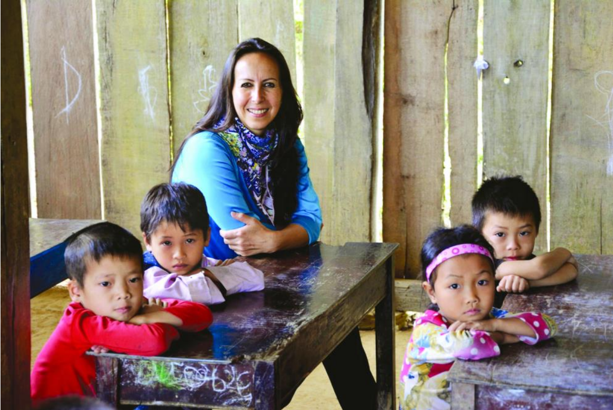
Nhà văn Isabelle Müller với trẻ em miền cao phía Bắc

Nhiều người có một cuộc sống đơn giản và yên bình. Những người khác có nhiều hành động, nhiệm vụ và bài học hơn để học. Khi tôi viết xong, một lần nữa tôi nhận ra cuộc sống có thể phi thường như thế nào, cuộc sống của tôi đã và đang vẫn còn phi thường như thế nào. Tôi rất biết ơn vì có thể trải nghiệm tất cả những điều đó, bởi tôi có thể hiểu hơn về những người khác, đồng cảm với họ và giúp đỡ họ đấu tranh.