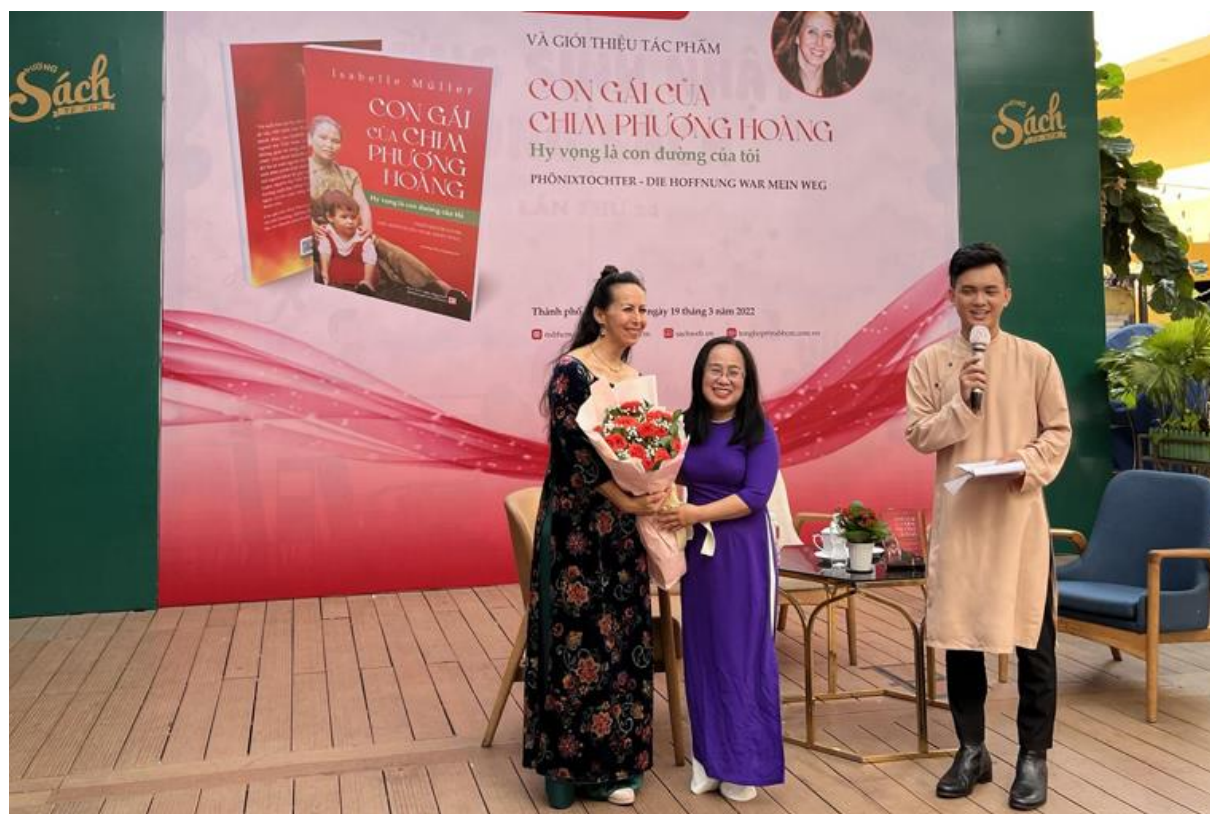
Đại diện Nhà xuất bản tặng hoa cho tác giả tại buổi giao lưu sáng 19/3.

Câu chuyện của Isabelle Müller không chỉ nói về việc tìm kiếm hạnh phúc mà còn về con đường để tìm thấy nó. Đó là việc biến bất hạnh thành hạnh phúc, là học cách biến vòng xoáy tiêu cực thành vòng xoáy tích cực. Cho dù bà “chắc chắn đã trải qua những điều tồi tệ, bao gồm lạm dụng tình dục, khủng bố tâm lý, kiệt sức, bị loại trừ, phân biệt đối xử, nghèo đói, phản bội”, nhưng đối lại, bà luôn tự nhủ: “Tôi cũng đã trải qua tình yêu đích thực, sự ấm áp, tình cảm, sự động viên, sẵn sàng giúp đỡ, sự đồng cảm, tình bạn, may mắn và hạnh phúc. Và tôi được phép sống khỏe mạnh ở đây trên trái đất và tận hưởng cuộc sống này.”