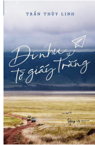
Đi như tờ giấy trắng