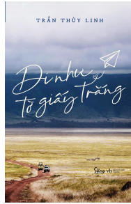
Đi như tờ giấy trắng