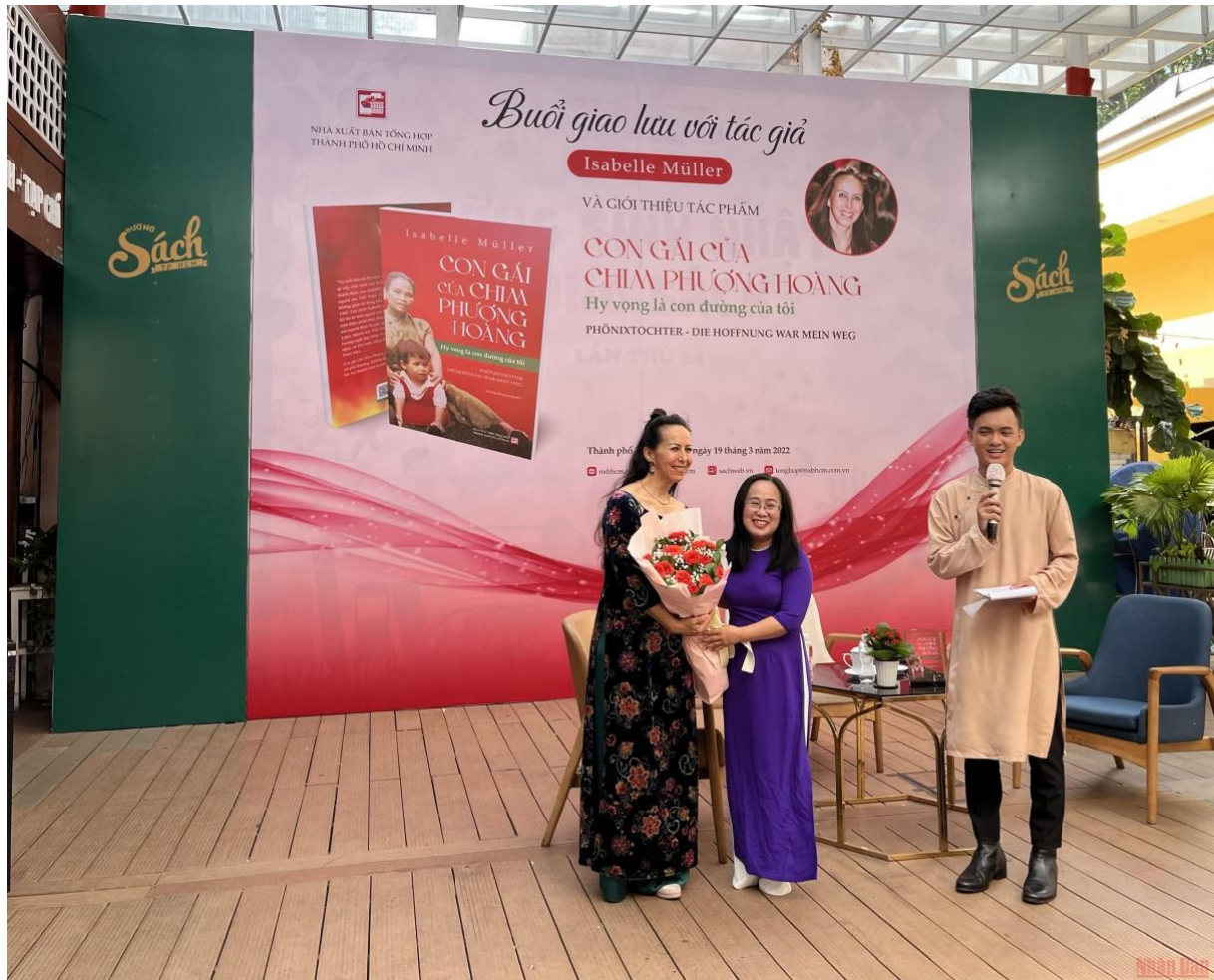
Đại diện Nhà xuất bản tặng hoa cho tác giả tại buổi giao lưu sáng 19/3.

Có thể thấy, dù đã trải qua những năm tháng tồi tệ nhất, bị chính người thân của mình lạm dụng tình dục, phải chịu đựng, phải câm nín, không thể nói với một ai, sống trong nỗi tuyệt vọng nhiều năm trời... đó là nỗi đau tột cùng mà Isabelle phải gánh chịu; thế nhưng bà đã không đầu hàng nghịch cảnh, cố gắng vươn lên và truyền cảm hứng cho mọi người.