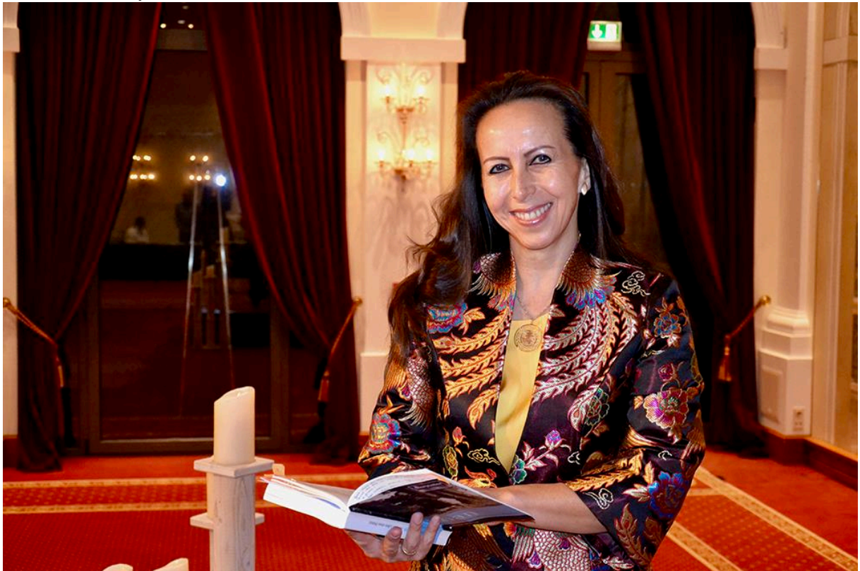
Tác giả Isabelle Müller

"Con gái của chim phượng hoàng - Hy vọng là con đường của tôi" của tác giả Isabelle Müller kể câu chuyện về một người phụ nữ xuất chúng, mang trong mình dòng máu Việt chảy trong huyết quản, không cho phép bản thân bị bất hạnh lấn át, làm chủ cuộc đời và cuối cùng - bất chấp mọi ràng buộc của số phận, trở thành doanh nhân thành đạt ở Đức.