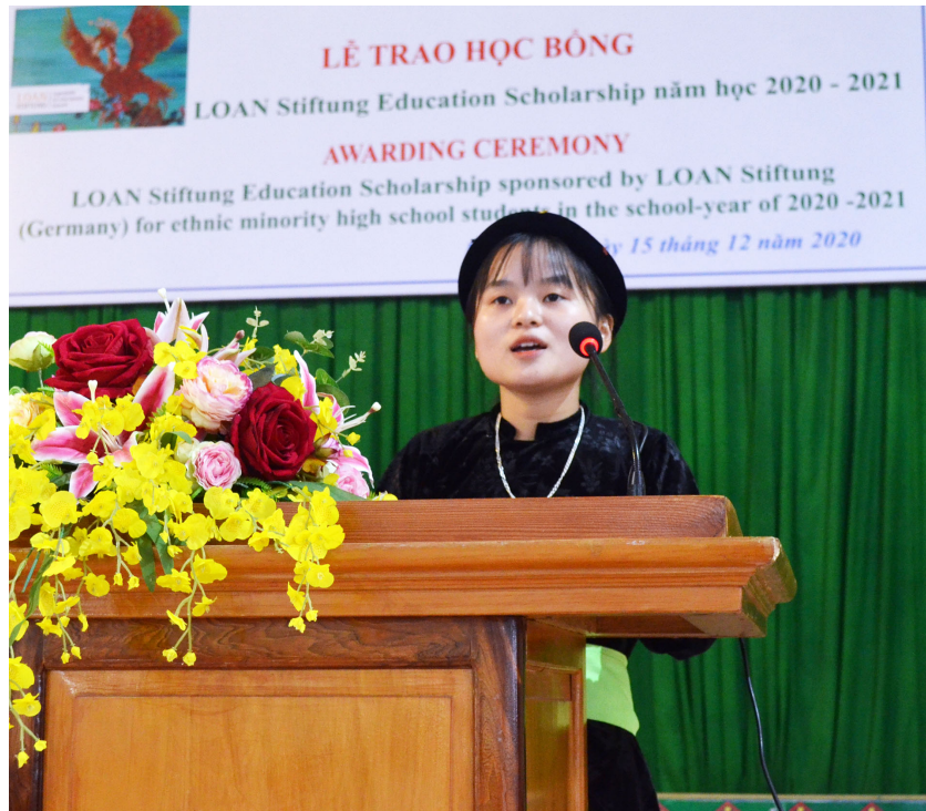
Đại diện các em học sinh nhận học bổng của tổ chức phát biểu cảm nghĩ tại buổi lễ

Sở và các cộng sự là cán bộ của Sở Ngoại vụ để tin tưởng và triển khai dự án tại địa phương. Bà cho rằng, tỉnh Hà Giang là địa phương còn khó khăn, nên việc mở rộng quy mô của dự án là điều đương nhiên, khẳng định các thành viên của Quỹ LOAN sẽ luôn sát cánh, đồng hành và sẵn sàng hỗ trợ các em với những điều tốt nhất. Mong mỗi sẽ được gặp lại các em, các cộng sự tại tỉnh Hà Giang vào thời gian tới khi mà dịch Covid-19 đã được kiểm soát./