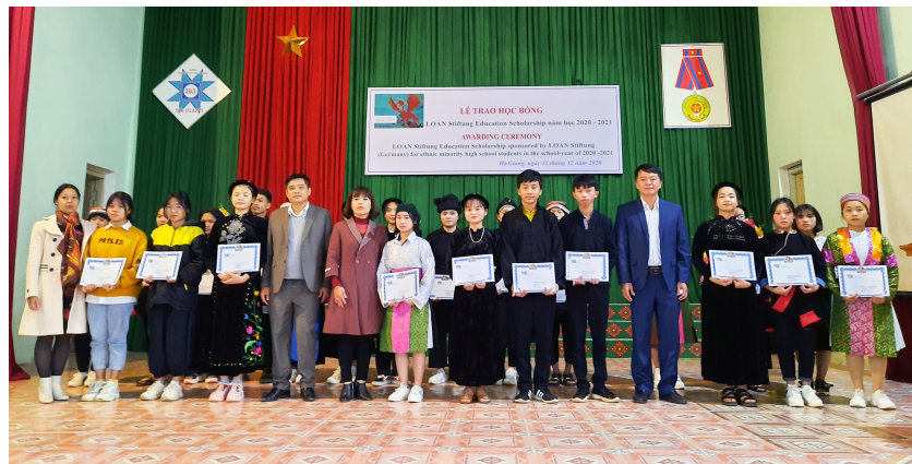
Các em học sinh, sinh viên trên địa bàn tỉnh nhận học bổng của tổ chức LOAN-Stiftung