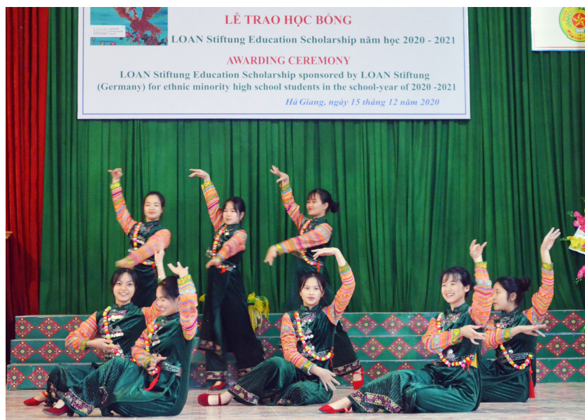
Một số tiết mục văn nghệ do các em học sinh trường PTDT nội trú tỉnh trình bày